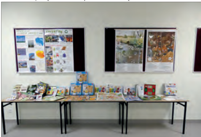
Wyposażenie klas przyrodniczych