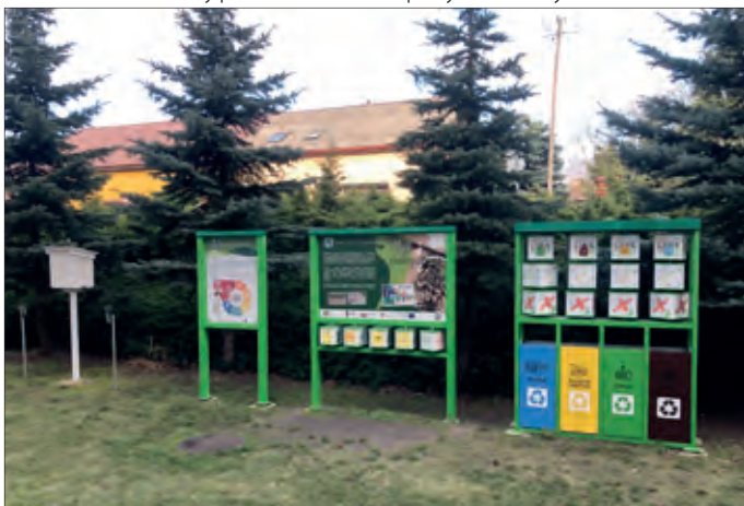
Ścieżka edukacyjno-ekologiczna przy SP Golina