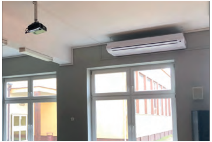
Klimatyzacja w SP Golina