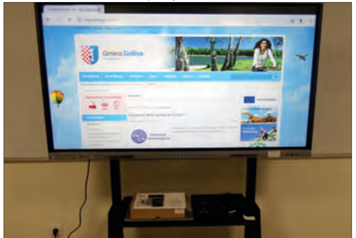
Ekrany multimedialne w szkołach