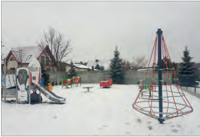
Plac zabaw przy SP w Kawnicach