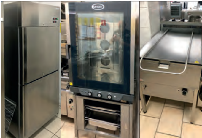
Sprzęt kuchenny na stołówkę w SP Golina